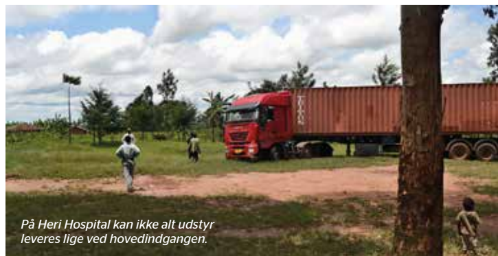
På Heri Hospital kan ikke alt udstyr leveres lige ved hovedindgangen.

Alle pengene til færdiggørelse af de lokaler, vi skal bruge til tandklinikken, kommer fra Støtteforeningen for hospitalet. Støtteforeningen har hjemsted i Tønder. Vi fik vand, elektricitet, afløb og kloak installeret, desuden vinduer, døre og fliser på gulvene. Lofter blev