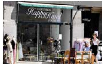
Happy Hand ligger midt i Københavns travle bydel: Nørrebro.