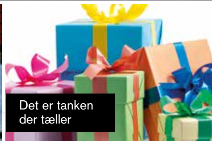
Det er tanken der tæller