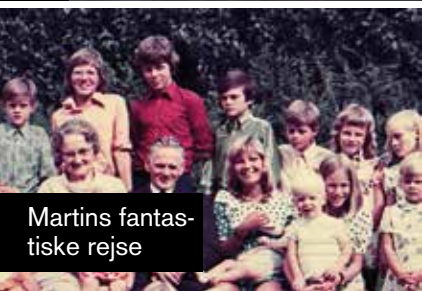
Martins fantastiske rejse