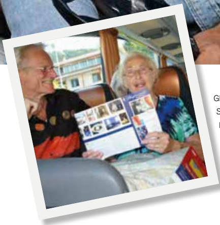
GLADE DELTAGERE SIGER: PÅ GENSYN I 2013.

hjemme i dette kalejdoskopiske tilbageblik over 2012. Danske og norske seniorer kan noget, når de forener kræfterne. I år reflekterede de over vores adventistiske arv, og hjalp hinanden til at finde vejen frem.