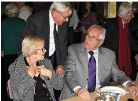
SENIORDAGEN I NÆRUM BØD PÅ BÅDE SANG OG MUSIK - OG FESTLIGT SAMVÆR.