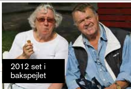
2012 set i bakspejlet