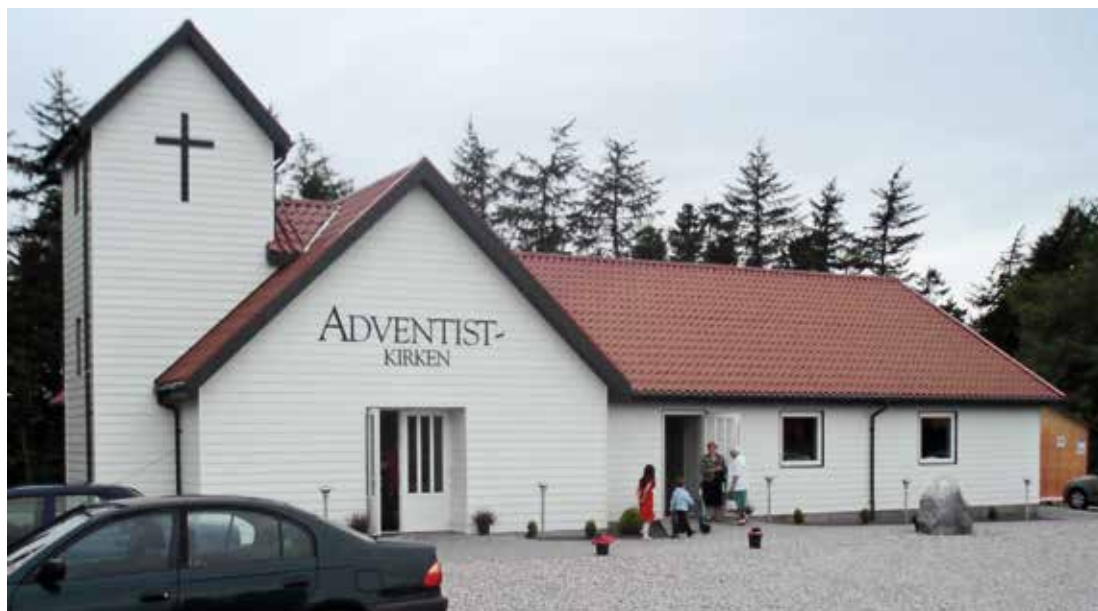
ADVENTKIRKEN, LL. NØRLUND RUMMER EN MENIGHED, DER FORSØGER AT TILPASSE SIG TIDENS KRAV.

De sidste paradigmeskifter kan til en vis grad identificeres ved overgangen fra det moderne til det postmoderne menneske. I 1920'erne havde postmodernismen sin spæde begyndelse. Det var imidlertid først efter afslutningen af 2. verdens-