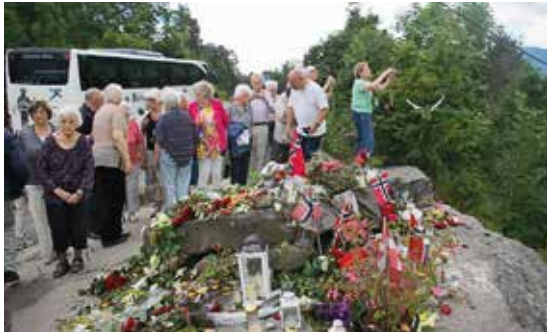
Dystre minder om Utøya.

forskellige skandinaviske lande eller endog på begge sider af Atlanterhavet.