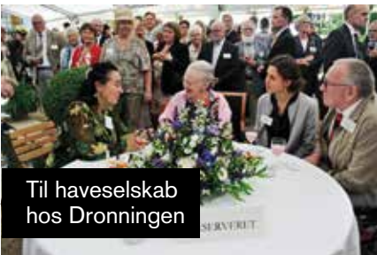
Til haveselskab hos Dronningen