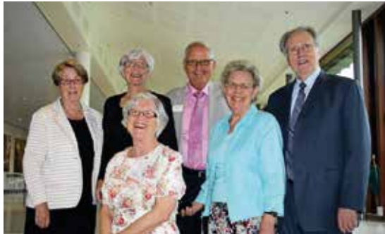
Afgangsklassen fra Vejlefjord 1954 blev genforenet.

i deres fælles vandring og indsats, der har ført dem fra Norge over Afrika og England til Adventistkirkens hovedsæde i Washington DC.