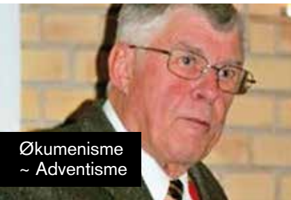
Økumenisme ~ Adventisme