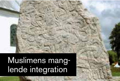
Muslimens manglende integration