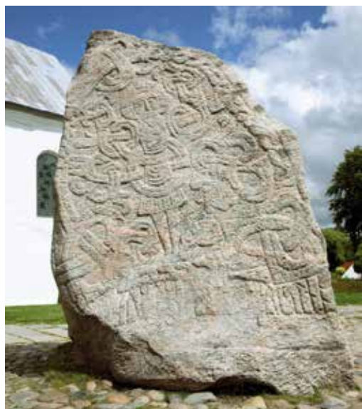
Jellingstenen, der er en del af et dansk pas, vil være en anstødssten for mange muslimer.

I det ideelle islamiske samfund er alle fjernsynsudsendelser, radioprogrammer, videoer og litteratur fra Vesten censurerede og ofte forbudte. Salg af alkohol og svinekød straffes med fængsel eller piskeslag. Alle kvinder skal være tildækkede for ikke at friste mændene. Prostituerede bliver offentligt henrettet, medens muslimske kvinder, der har omgang med ikke muslimske mænd, kan risikere æresdrab.