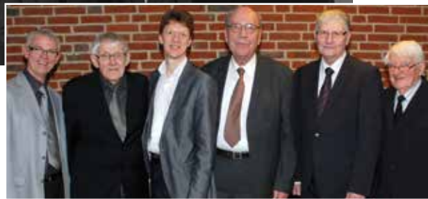
To personer går igen på de to fotos – fra hhv 1953 og 2011.

elever kan inspireres til yderligere indsats for Guds rige.