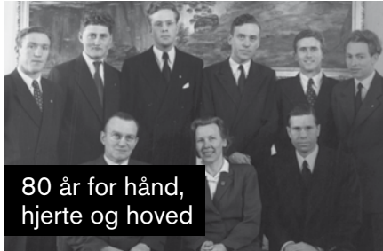
80 år for hånd, hjerte og hoved