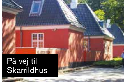
På vej til Skarrildhus